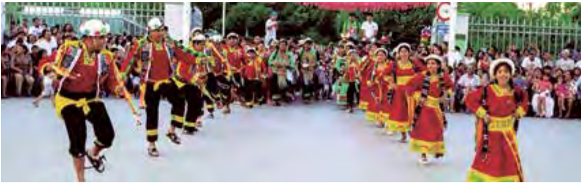
El folclor boliviano llevado a su máximo esplendor este domingo 13 de enero en el Parque del Mar

Es un evento cultural reivindicativo participarán más de 25.000 danzarines de al menos 63 ciudades en 21 países