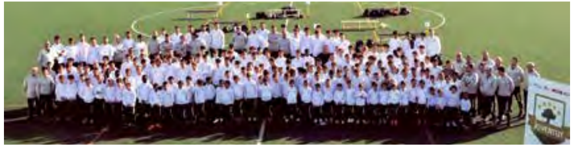
El día de la presentación oficial de las diferentes categorías del Joventut Son Oliva

de recibirlos con los brazos abiertos”, dice el dirigente, quien es muy conocido en el ámbito latinoamericano por colaborar en torneos de selecciones y ser abierto a las propuestas de los diferentes colectivos que apuesten por la integración a través del fútbol.