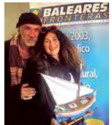
Durante su visita a BSF.