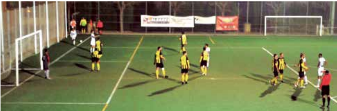
El sábado 5 de enero, Baleares Sin Fronteras FC derrotó 6-1 a Es Cardassar en Son Moix

Este sábado 12 de enero el equipo visita al emblemático Independiente de Palma, tercero clasificado, y luego comienza la segunda vuelta el 19 de enero enfrentando al Olímpic de Felanitx en ese municipio mallorquín, dos partidos seguidos fuera de Son Moix, un reto nada fácil teniendo en cuenta la necesidad de buscar la permanencia en Primera ●