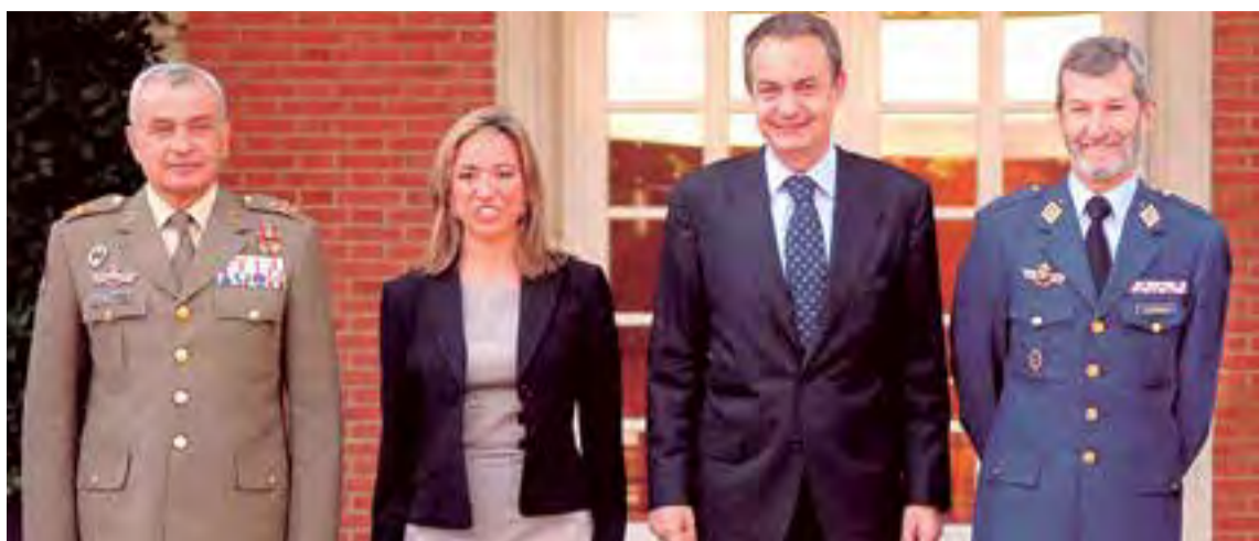
De izquierda a derecha, Fulgencio Coll, la ministra Carmén Chacón, Zapatero y Julio Rodríguez.

¿Por qué va sorprendernos que VOX pretenda colocar como candidato a la Alcaldía de Palma a Fulgencio Coll? Otro exgeneral de Estado mayor