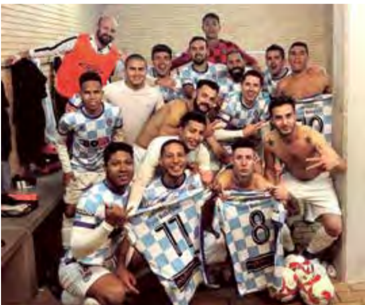
El triunfo en el vestuario de BSF FC traducido en alegría