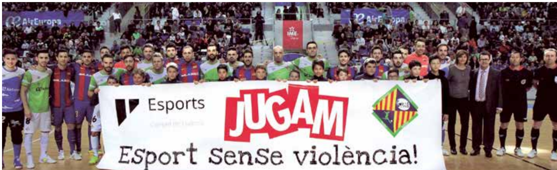
Palma y Barcelona posan con el Alaró infantil de fútbol para expresar su deseo de erradicar la violencia en las prácticas deportivas.