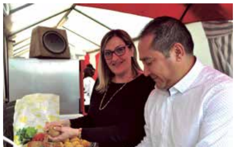
Personas de varias nacionalidades asistieron al evento benéfico