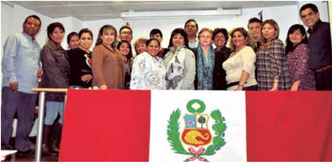
Desde Baleares, peruanos y residentes de otras nacionalidades suman esfuerzos solidarios para Perú.