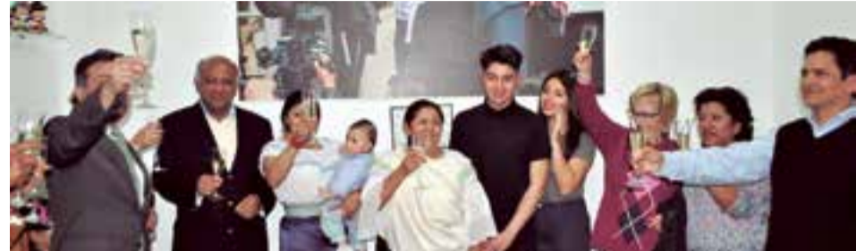
El momento del brindis a la homenajeada de la noche

El cónsul de su país, Freddy Arellano destapó un enorme cuadro en el que aparecía la homenajeada fundida en un abrazo con el presidente, Rafael Correa