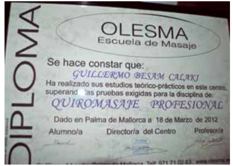
El diploma que acredita la formación específica de Guillermo Besam.