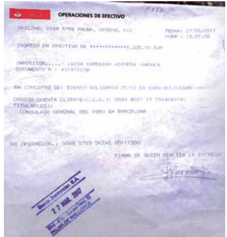
Constancia del ingreso del dinero recaudado mediante el acto solidario.

De la misma forma, de la Cruz desconoce si el consulado peruano está liderando algún evento, no obstante, enfatizó que el de Barcelona abrió una cuenta para que los ciuda-