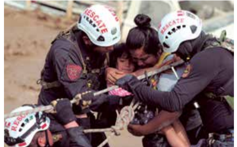
La dramática situación que se está viviendo en Perú también ha despertado el espíritu solidario de los directivos, padres y niños del colegio Santa Mónica.