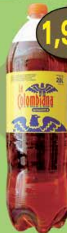
Postobon LA COLOMBIANA 2 l.