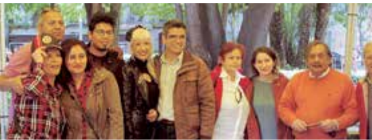
Representantes del Ayuntamiento de Palma, organizadores y voluntarios

La Asociación Illariq y varios agentes sociales con la colaboración del Ayuntamiento de Palma permitieron la realización de la jornada