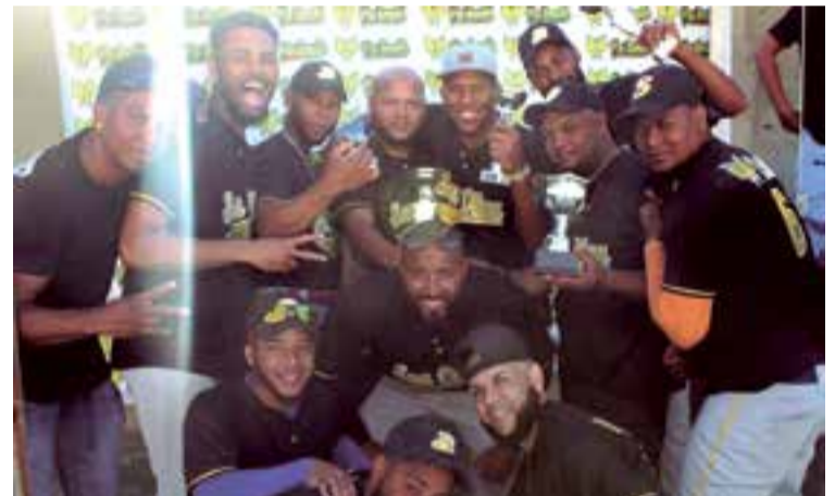
Los jugadores de Son Oliva exhibiendo la copa de ganadores del torneo

La empresa privada no ha sido ajena a esta iniciativa, y por ello, los equipos debutantes esta temporada Mediterráneo y el campeón Son Oliva han sido patrocinados por la discoteca Palante Music Club ■