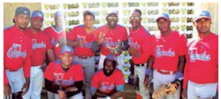
Mallorca Cardenales, uno de los primeros equipos en fundarse en la Isla