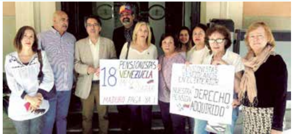
A la salida del Parlament con una pancarta alusiva al impago de las pensiones a los venezolanos