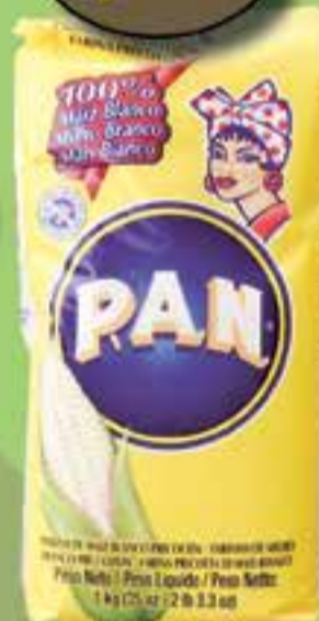
Harina PAN 1 kilo.