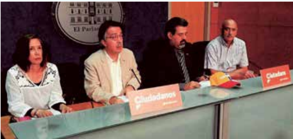
Representantes del grupo parlamentario Cs (Ciudadanos) con integrantes de la AVEB

Desde el grupo parlamentario se hace un llamamiento al gobierno de Venezuela a garantizar el derecho constitucional de sus ciudadanos