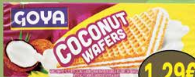
Wafer Coconut GOYA 140 g.