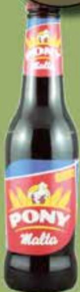
PONY MALTA 330 ml.