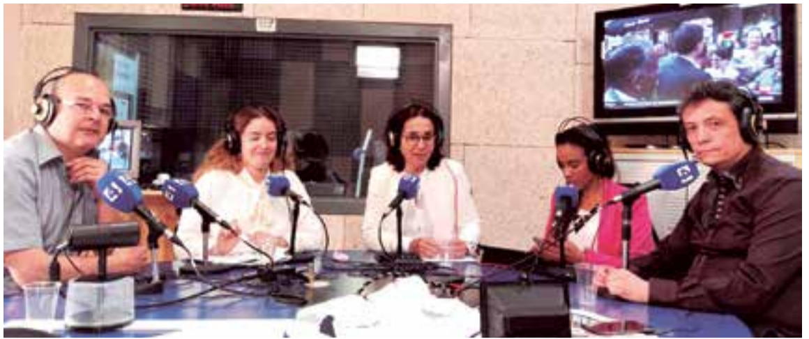
En uno de los momentos de Baleares Sin Fronteras Magazine que se emite en la 88.4 y 89.0