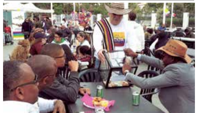
El cónsul de Colombia recogiendo donaciones de varios dominicanos.