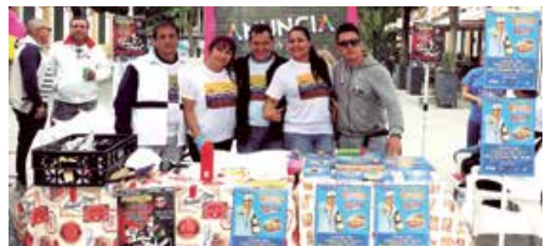
Empresarios y voluntarios reunidos por esta noble causa.