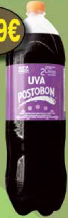
Postobon uva LA COLOMBIANA 2 l.