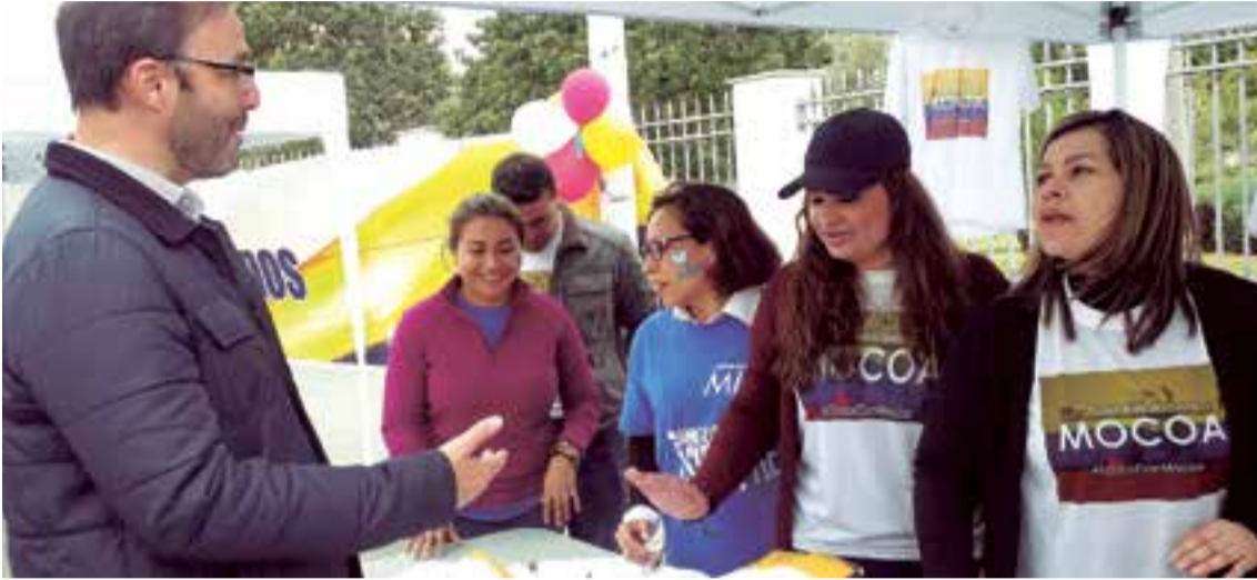
El alcalde de Palma, José Hila visitando el stand de venta de camisetas solidarias por Mocoa

La jornada se realizó el pasado 30 de abril en el Parque de las Estaciones de Palma