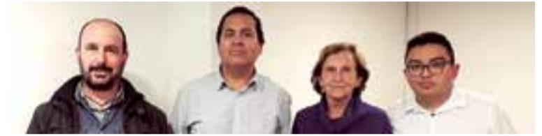
Presentación de la muestra fotográfica acerca de la comunidad Mapuche

En una carta enviada a nuestra redacción comentan que "nuestro partido queda a disposición de Baleares Sin Fronteras para que nos vayan conociendo, creemos que podemos aportar mucho al mundo de la inmigración en Baleares y en España, dando a conocer casos de verdadera integración y solidaridad internacional" ■