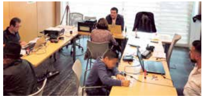
Una delegación de Palma se desplazó a Ibiza y Menorca a atender a los colombianos residentes en esas dos Islas