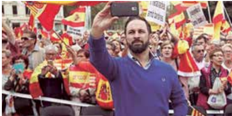
Santiago Abascal, líder nacional de VOX, durante un mitin.

Acabar con el efecto llamada: cualquier inmigrante que haya entrado ilegalmente en España estará incapacitado, de por vida, a legalizar su situación y por lo tanto a recibir