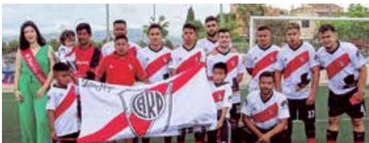
River Plate, el equipo mejor uniformado de la apertura del nuevo torneo