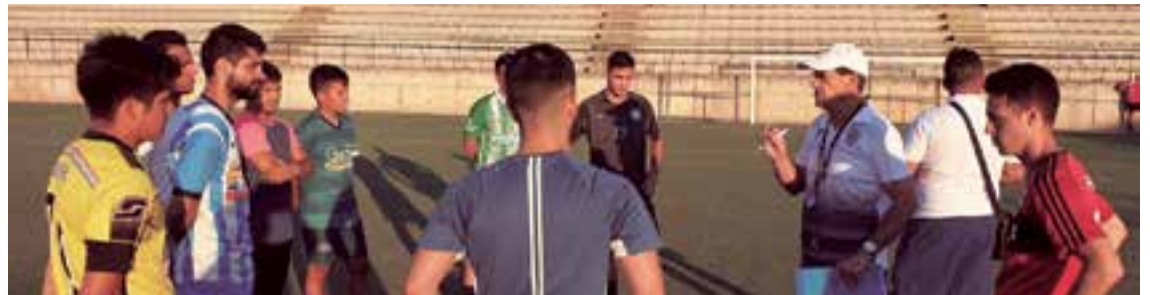
Un éxito la convocatoria de puertas abiertas para nuevos jugadores del BSF FC para la temporada 2019/20

En la temporada 2018-2019 descendieron: CD Son Cladera, CD Murense y CE Mercadal. Al ser una temporada compuesta por 21 clubes, se decidió que en caso de que algún equipo de la máxima categoría balear ascen-