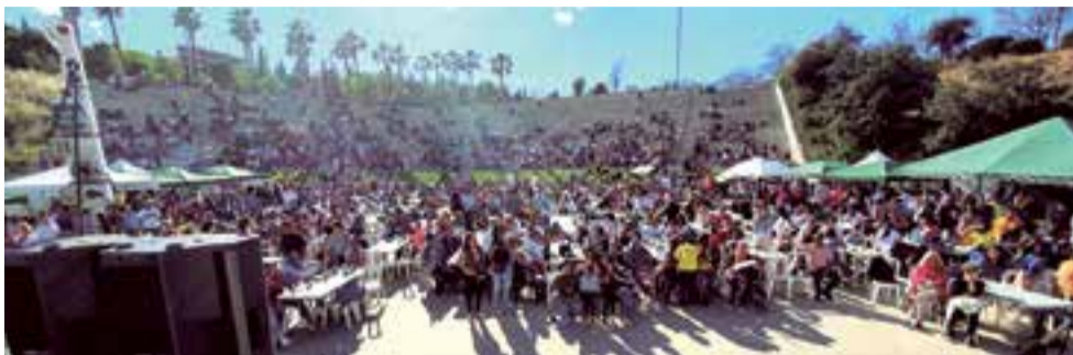
Arriba: de los planos generales de las pasadas fiestas patrias de Colombia en Sa Riera

En años pasados la asistencia ha sido multitudinaria, esta edición nos será la excepción