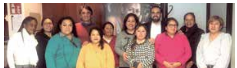
Colaboración entre el Consulado de Ecuador y Treball Solidari de auto empleo