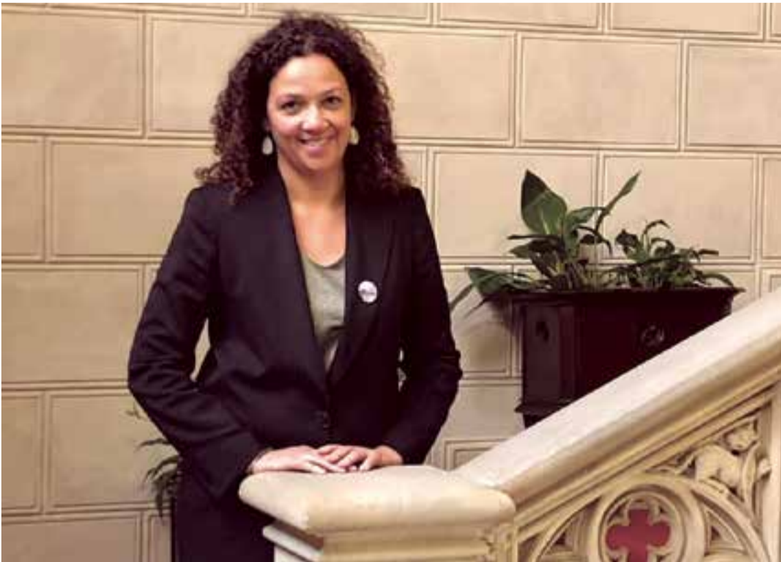
Un nuevo reto le espera a Catalina Cladera en la presidencia del Consell Insular de Mallorca tras haber sido la Consellera de Hacienda la pasada legislatura en el Govern presidido por la también socialista, Francina Armengol

necesidad en particular también debe ser atendida y orientada, su condición migratoria no le quita su derecho a la denuncia.