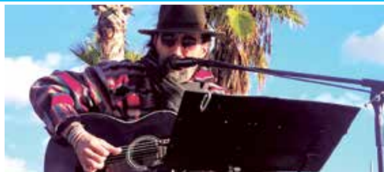
El cantante mallorquín, Francesc Bonnín, se unió a la causa solidaria