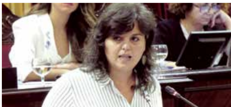
Cristina Mayor, diputada de Unidas Podemos por Menorca

del Ministerio del Interior correspondientes al año 2018, en Palma los delitos contra la libertad sexual se han incrementado el 20,9 por ciento (de 196 a 237 casos) mientras que las violaciones han pasado de 26 a 33 (un incremento del 33,3 por ciento). Los delitos relacionados con el tráfico de drogas han aumentado el 51,9 por ciento. Con los datos del segundo trimestre de 2019 se constata que Baleares se sitúa a la cabeza de España con una tasa de criminalidad de 68,4 infracciones penales por cada 1.000 habitantes, muy por encima de la media nacional que es de 46,6 casos por cada 1.000 habitantes.