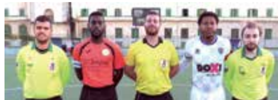
El equipo que formó frente al Pílares la Soledad y los capitanes con los árbitros del partido de la última fecha