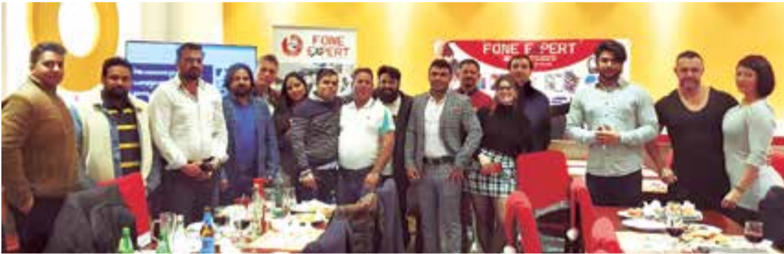
Trabajadores, colaboradores y amigos de la empresa Fone Expert de Palma en la cena de fin de año