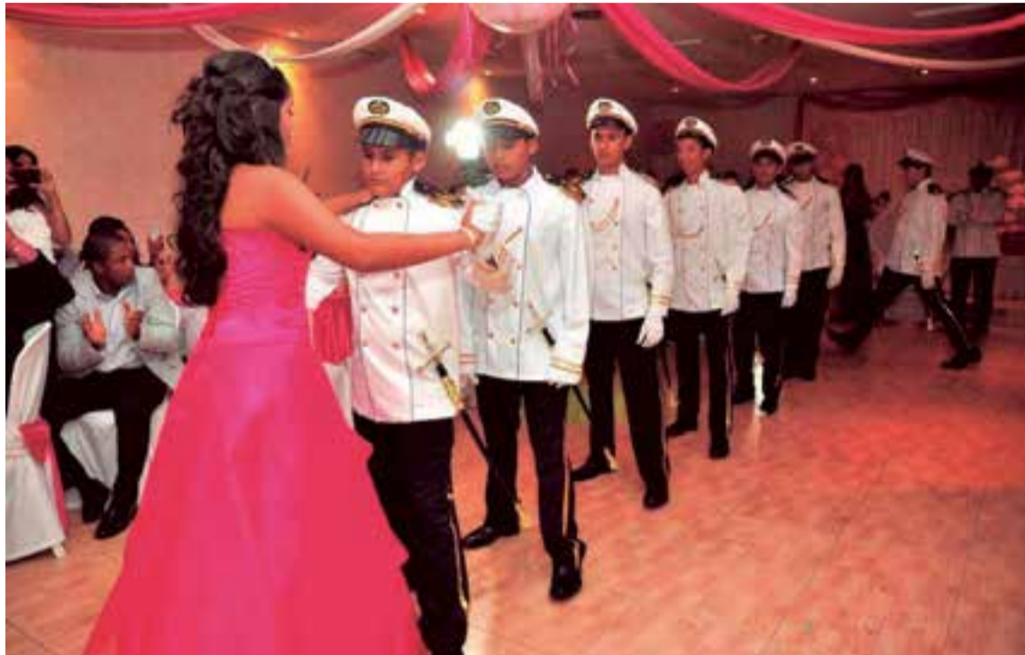
Las costumbres típicas de las celebraciones de quince años se han exportado desde Latinoamérica a Mallorca

H emos considerado de vital importancia reproducir íntegro el trabajo periodístico de la redactora previa autorización y acuerdo con la dirección del diario mallorquín. La participación de nuestro medio, Baleares Sin Fronteras en la noticia y la importancia de sus contenidos nos ha motivado a transcribir al detalle el reportaje para quienes no hayan tenido la oportunidad de leerlo.