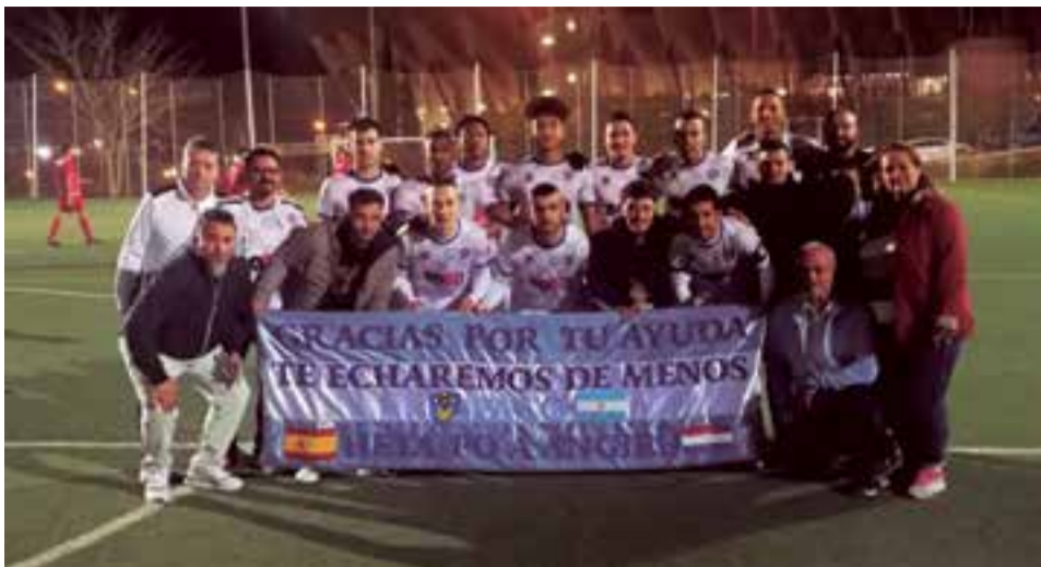
El equipo Baleares Sin Fronteras Fútbol Club juega en la segunda regional de la Federación Balear