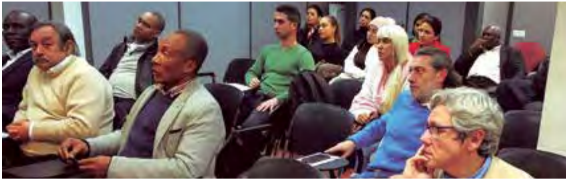
La Plataforma de Asociaciones por la Inmigración se reúne este 28 de febrero para abordar problemáticas sociales

El descontento es generalizado por lo que se ha anunciado una reunión clave este 28 de febrero en el Casal de la Inmigración, localizado en la calle Eusebio Estada, 48 de Palma