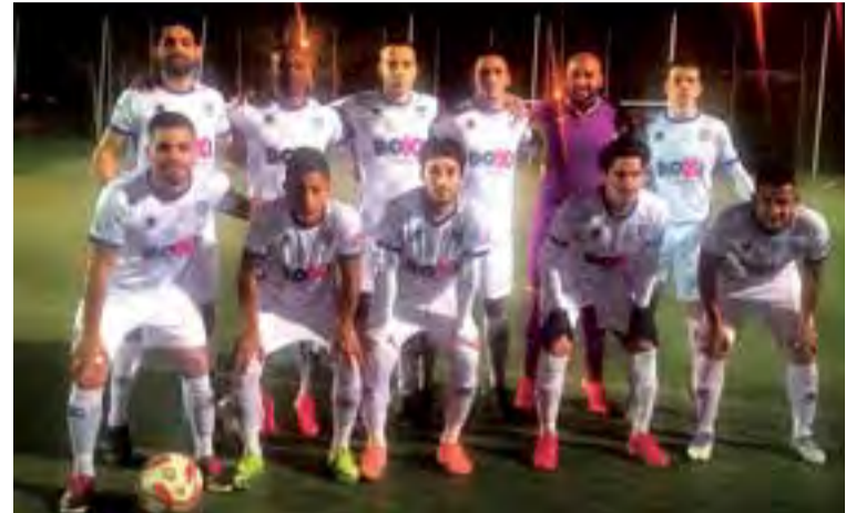
Formación que comenzó jugando en la victoria contra Montuïri 1-0