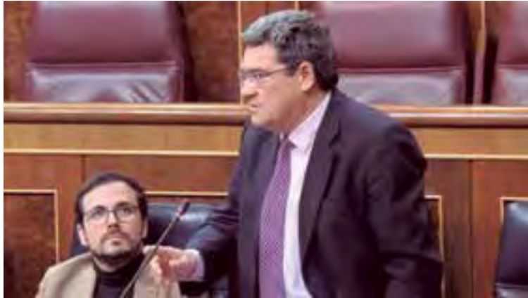
José Luis Escrivá, ministro de Inclusión, Seguridad Social y Migraciones

El ministro se ha comprometido a establecer objetivos y métricas de inclusión para las políticas públicas, de forma que se puedan evaluar todas las actuaciones de los poderes públicos. “Estos objetivos y métricas inclusivas son algo muy novedoso en la administración española y servirán para valorar con la mayor exactitud y de la forma más ajustada las nece-