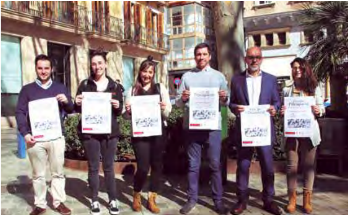
La Feria del Empleo se realizará el 4 y 5 de marzo en el Palacio de Congresos de Palma

Ambas jornadas tendrán lugar en el Palacio de Congresos entre las 9.30 y las 17h