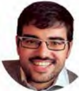
Por Alex Pomar

Buenas sensaciones a falta de de once jornadas para que termine la liga regular en la Segunda Regional mallorquina