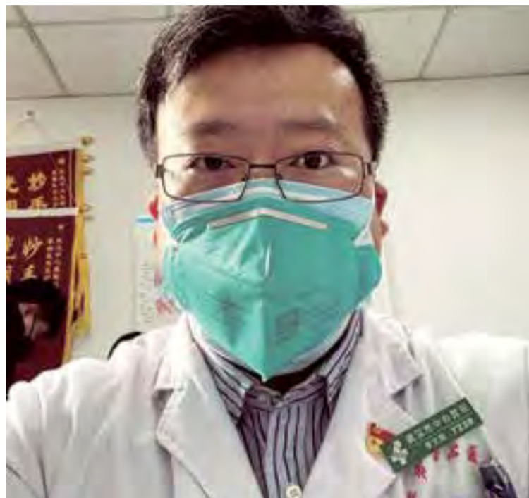
Li Wenliang, médico chino fallecido, quien alertó sobre el nuevo coronavirus.

“China debe aprender la lección del caso de Li y adoptar un enfoque que respete los derechos humanos para combatir la epidemia. Nadie debería sufrir hostigamiento ni sanciones por pronunciarse