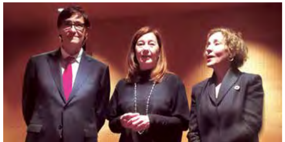
La nueva Delegada del Gobierno en Baleares junto a Francina Armengol, Presidenta del Govern balear y el Ministro de Salud, Salvador Illa