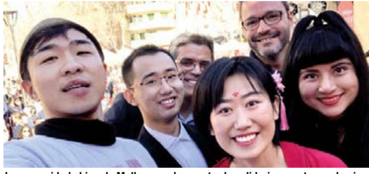
La comunidad china de Mallorca se ha mostrado solidaria en esta pandemia con varios donativos a entidades públicas y privadas