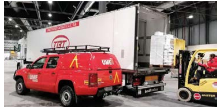
La empresa de lácteos también ha hecho donativos de mascarillas

Desde el Grupo TGT tenemos claro que no llevaríamos casi 60 años de existencia como empresa si no