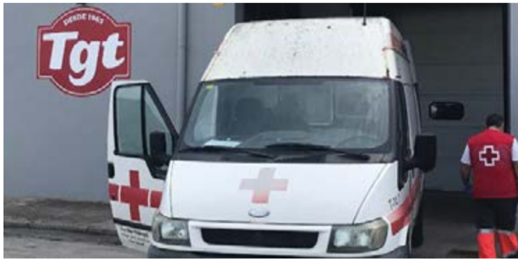
TGT haciendo donaciones a entidades sociales para colectivos

En línea con su política de apoyo a las comunidades locales y su lucha contra la pandemia de COVID-19, el Grupo TGT, a través de su delegación de Mallorca, está realizando donaciones de productos lácteos y, hasta la fecha, ha donado un total de 8.508 kilos a instituciones, entidades, asociaciones públicas y privadas que atienden a personas vulnerables en el marco de su com-