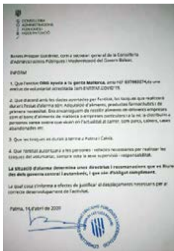
Documento acreditativo del Govern balear para poder repartir alimentos