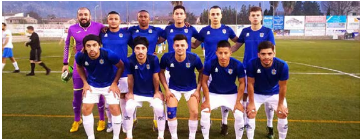
Baleares Sin Fronteras FC, como otros clubs amateurs, a la espera de lo que decida el comité de competición de la FFIB.

¿Está de acuerdo en resolver los ascensos de categoría en un playoff exprés, a una misma sede de concentración y en partido único por eliminatoria, asegurando la máxima seguridad sanitaria?