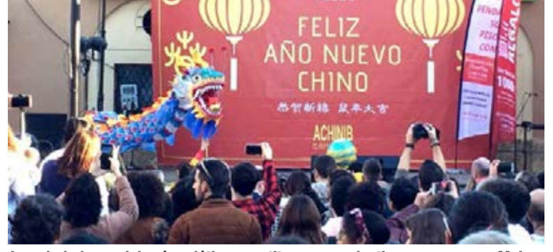
Los ciudadanos del país asiático constituyen un colectivo numeroso en Mallorca, en barriadas populares como Pere Garau