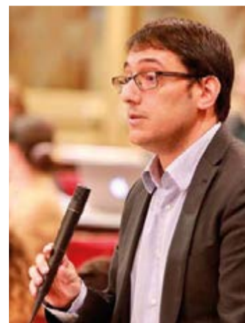
El conseller de trabajo del Govern, Iago Negueruela.

Lo mismo sucede con aquellos productores de cultivos como el de la cereza del valle del Jerte, los nísperos de Alicante o los horticolas como el ajo en zonas productoras como Granada, Córdoba y Cuenca, el espárrago de Guadalajara o las cebollas y patatas de Valencia ●