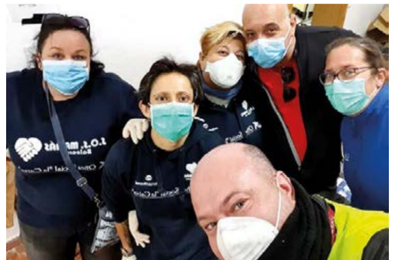
Junto con varias voluntarias de SOS Mamás