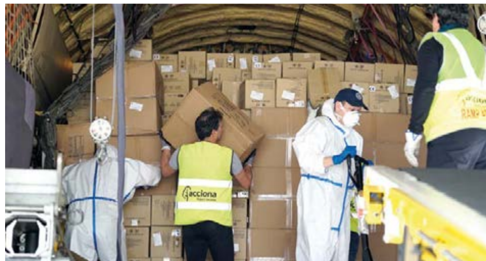
El Servicio de Salud refuerza el abastecimiento de material sanitario a las oficinas de farmacia de las Illes Balears