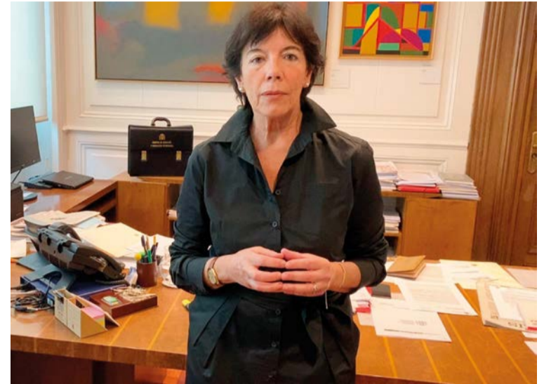
La ministra de Educación, Isabel Celaá, ha desatado una gran polémica con el comienzo del trámite parlamentario de su proyecto de ley

Aumento de las plazas públicas 0-3 años. Promover la existencia de centros públicos que incorporen Infantil con otras etapas