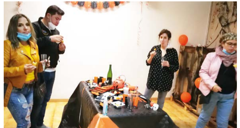
Una pequeña comitiva se reunió en la inauguración de la nueva empresa de envíos de paquetería y remesas.