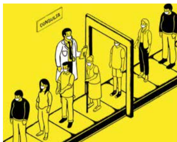
Imagen de animación .gif utilizada en la nueva campaña

“Todo se ha agravado con la pandemia, pero la Sanidad Pública lleva años en bucle: listas de espera interminables, personal sanitario agotado, protestas, precariedad laboral, falta de financiación, promesas incumplidas