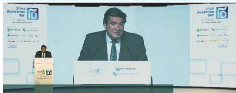
José Luis Escrivá, ministro de Inclusión, Seguridad Social y Migraciones, durante su intervención en el foro Spain Investors Day.

“Nuestras medidas, ha indicado, han estado especialmente bien diseñadas para favorecer la activación de trabajadores suspendidos en cuanto las condiciones lo permitieron”. Además, ha subrayado que, a diferencia de lo que ocurrió en la anterior crisis, “estas medidas han logrado que la caída de la actividad no se transforme automáticamente en una aún mayor pérdida de empleo”, y evitando este posible incremento masivo del desempleo, “han