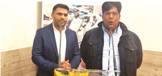
El anfitrión de la noche junto al empresario Chaudhry