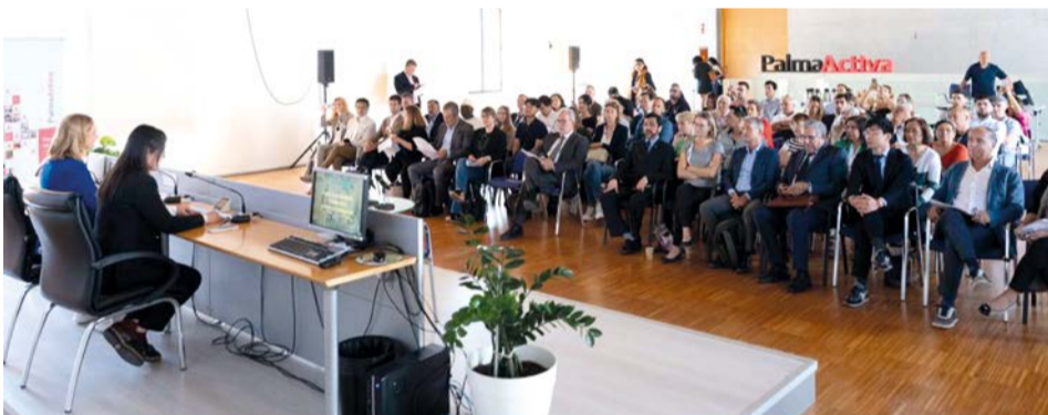
Como se aprecia la convocatoria del foro fue un éxito por la gran afluencia de empresarios que se hicieron presente en el salón de actos de Palma Activa.