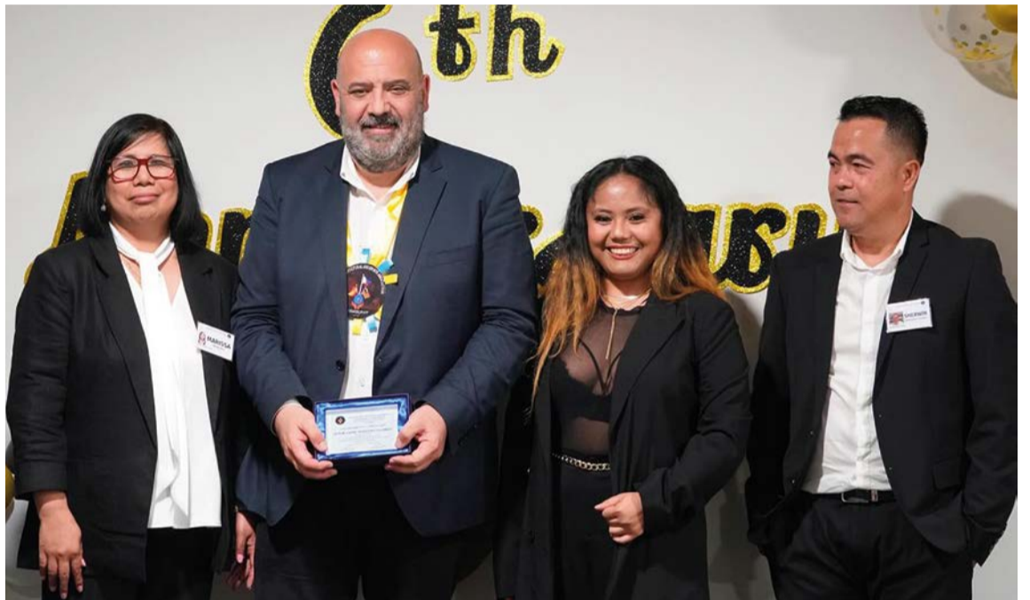
Proactivo se muestra el alcalde de Palma con las asociaciones de extranjeros residentes en Palma, en la foto superior con la asociación de bolivianos y en la imagen inferior con el colectivo filipino.

Tenemos que revertir la situación el año pasado, la ciudad no estaba en unas condiciones no muy adecuadas de limpieza y seguridad, estamos cambiando esa situación. Estamos incrementando los efectivos policiales con el objetivo de que haya trescientos más a final de legislatura. Estamos incrementando con acciones puntuales extraordinarias la limpieza en los barrios.