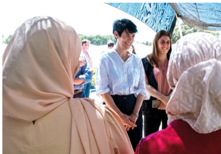
La ministra de Inclusión, Seguridad Social y Migraciones, Elma Saiz, durante su visita a Huelva, conversando con mujeres marroquíes.

testimonio de dos de las participantes, una de las cuales ha abierto una tienda de ropa, mientras que otra ha optado por un comercio de venta de ultramarinos, que da trabajo a varios miembros de su familia y distribuye alimentos por la comarca.