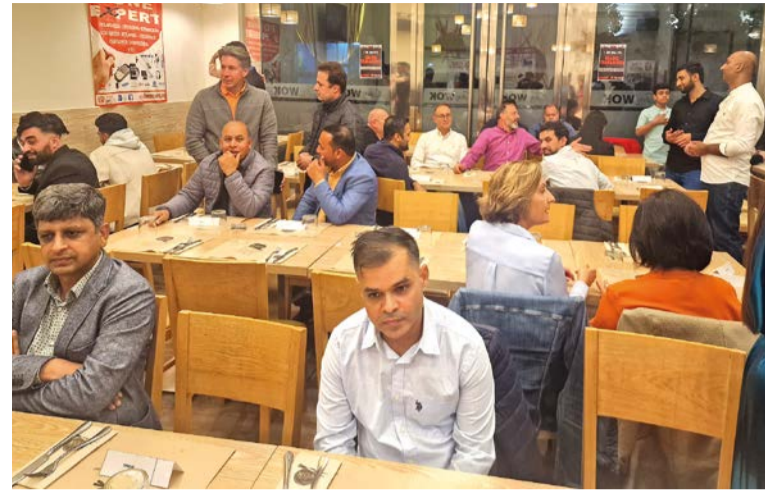
Una velada a la que asistió todo el personal de Fone Expert y SUMAS