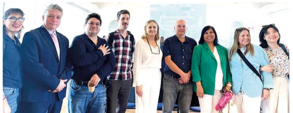
Asistentes al foro, entre los que se encontraban autoridades del ayuntamiento, representantes de asociaciones, ponentes y empresarios.