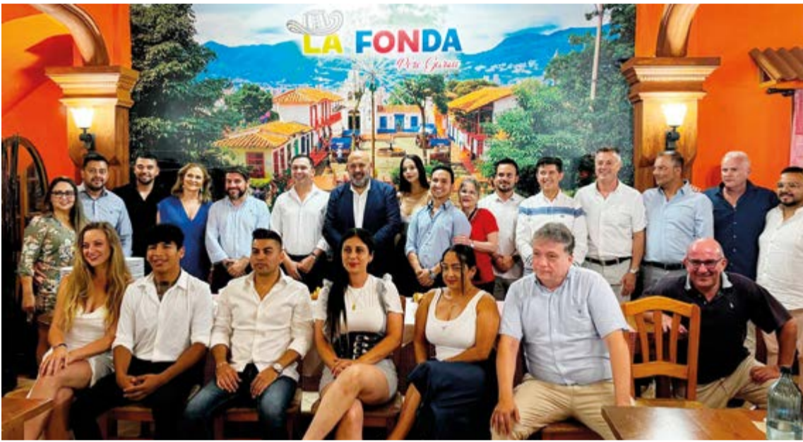
Todos los invitados a la inauguración de la segunda "Fonda" de Pere Garau en Palma.

Un bufete de picada – comida típica de Colombia- fue el abrebotas en la inauguración de este nuevo local, ubicado en las inmediaciones de la Plaza Pere Garau de Palma