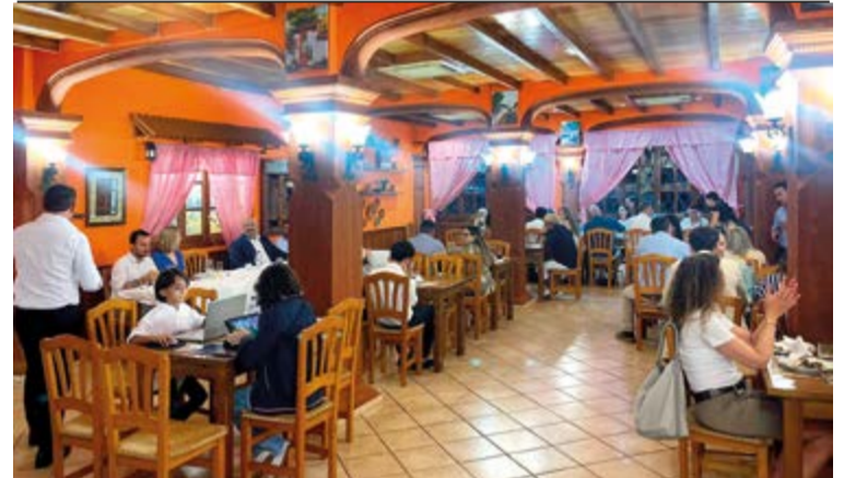
Un plano genérico del local que ya abrió sus puertas al público.