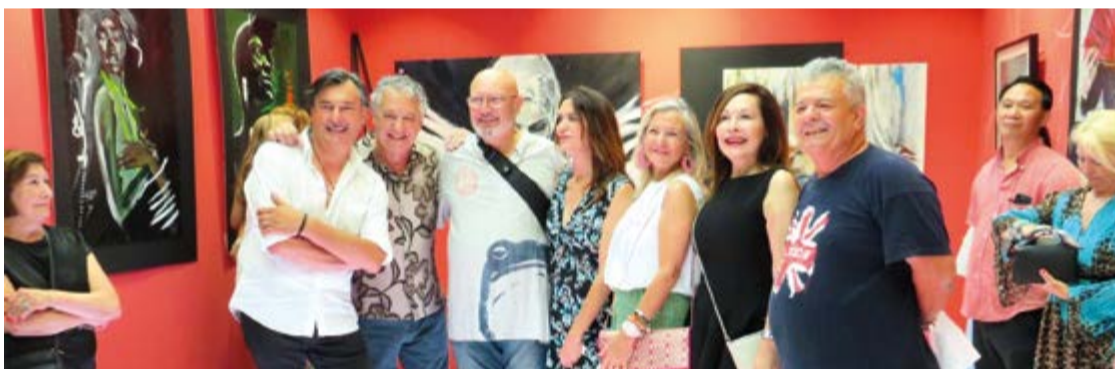
Éxito rotundo en la Expo Raza del Hotel Artmadams

Una exposición llena de color y vida que seguirá a disposición de todo aquel que guste de disfrutarla, hasta el próximo 14 de Agosto, en la sala Skylight del Hotel Artmadams, para deleite de quienes gusten de unos trazos imperpinentes y de continua innovación, reflejo de la paleta cromática en su "Raza" ●