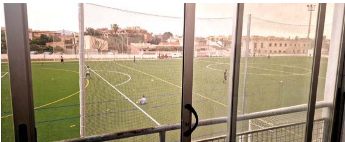
BSFFC inicia su nueva etapa en el Fútbol Base.