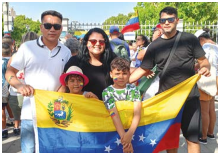
Numerosos venezolanos se congregaron en la plaza intermodal de las estaciones de Palma para seguir el proceso electoral y manifestarse.

cias que llamó la atención de los congregados es el cambio de recintos electorales en Venezuela, pasando de una provincia a otra. Aparte de este hecho, las colas eran interminables en los consulados y el plazo terminaba el 16 de abril.