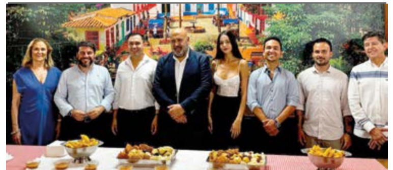
Autoridades del Ayuntamiento de Palma y del Consulado de Palma junto a los propietarios