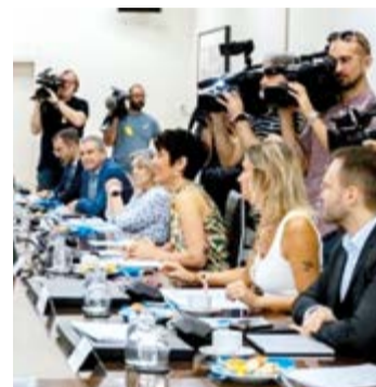
La ministra Elma Saiz, acompañada de la secretaria de Estado Pilar Cancela, informa sobre la situación migratoria actual.

La reforma regula mecanismos que permitan formar talentos, fomentar su empleabilidad y retenerlos.