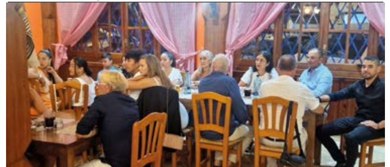
Gente del mundo empresarial y diversos ámbitos invitados a la inauguración