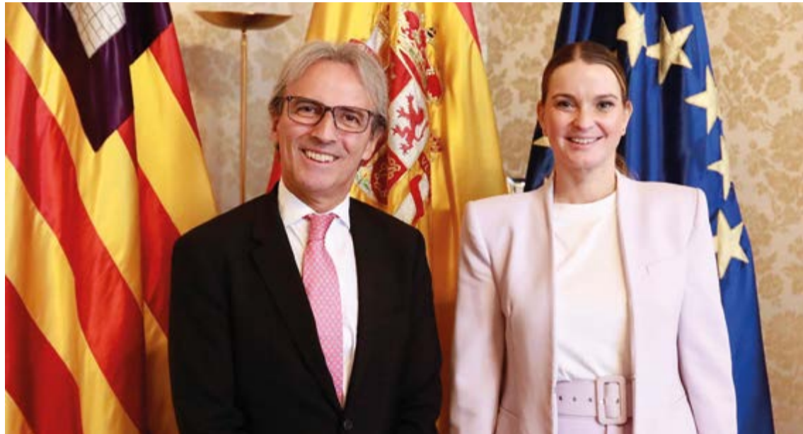
El embajador de Colombia en España, Eduardo Ávila, junto a Margalida Prohens, presidenta del Govern Balear.