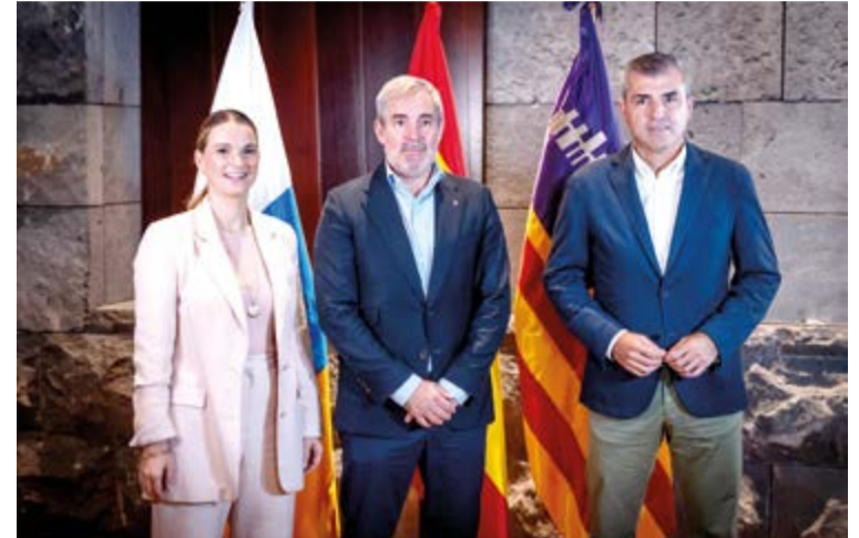
Reunidos en Tenerife, Margalida Prohens, presidenta del Govern de les Illes Balears, con el presidente de Canarias, Fernando Clavijo.