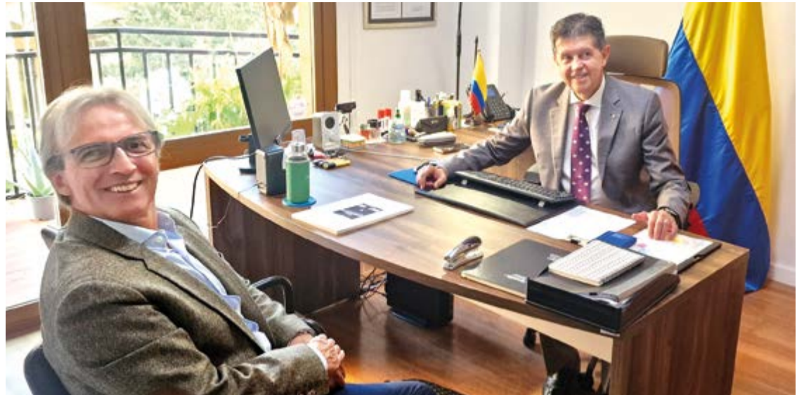
El embajador de Colombia en España, Eduardo Ávila, en su visita al despacho del cónsul de Colombia en Baleares, Rafael Arismendi

E.A: El gobierno colombiano tiene su posición y respetamos la libre decisión de los otros países sobre sus políticas exteriores ●