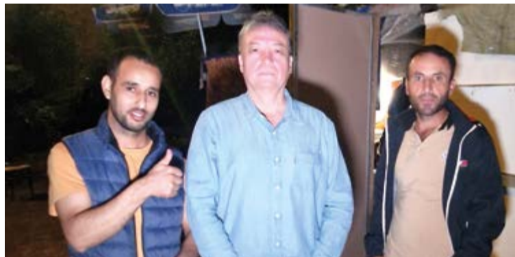
Dos jóvenes de Argelia llegados en patera nos cuentan su arriesgada travesía para llegar a Mallorca.