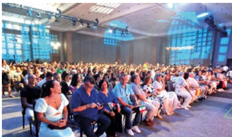
Acto de reconocimiento a líderes y talentos de Immunotec.