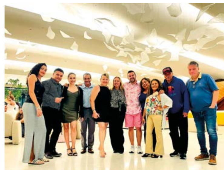
BSF acompañando a los consultores sobresalientes de Immunotec.