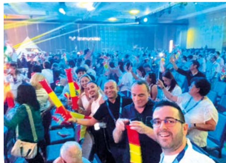
En Cancún, los llegados desde los diferentes puntos de España.