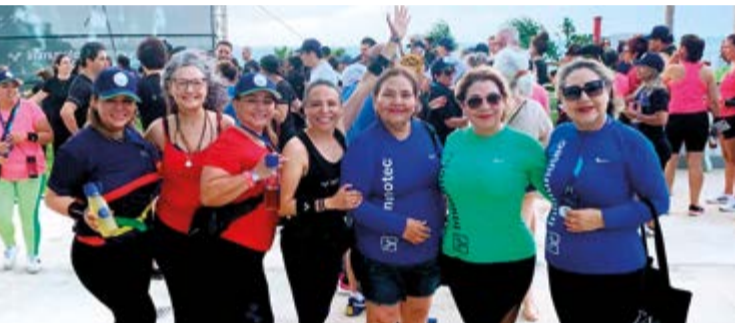
Las mujeres participaron en animadas jornadas recreativas y deportivas de immuotec. Las consultoras no desaprovecharon la oportunidad para lucir las banderas de sus países.