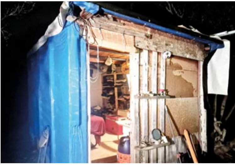
Baleares Sin Fronteras estuvo a pie de calle conociendo las opiniones y necesidades de algunos de los habitantes sin hogar.