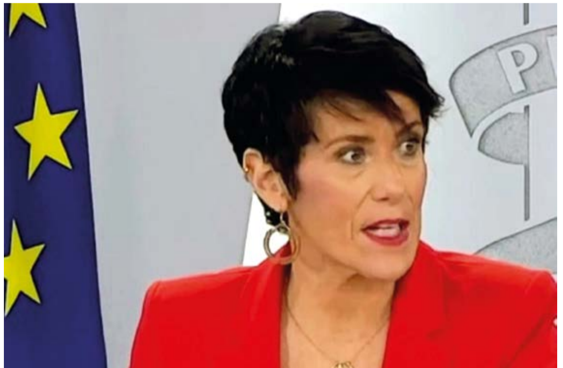
La ministra de Inclusión, Seguridad Social y Migraciones, Elma Saiz

“Debemos permitir a las personas realizar su proyecto de vida en España facilitando los cambios de estatus, por ejemplo, si un estudiante viene a formarse y luego se incorpora al mercado laboral, o si un familiar reagrupado decide obtener un permiso de trabajo propio”, ha explicado