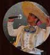
FLOR DORADA LA DIVA DEL MARIACHI Y LA MÚSICA POPULAR.