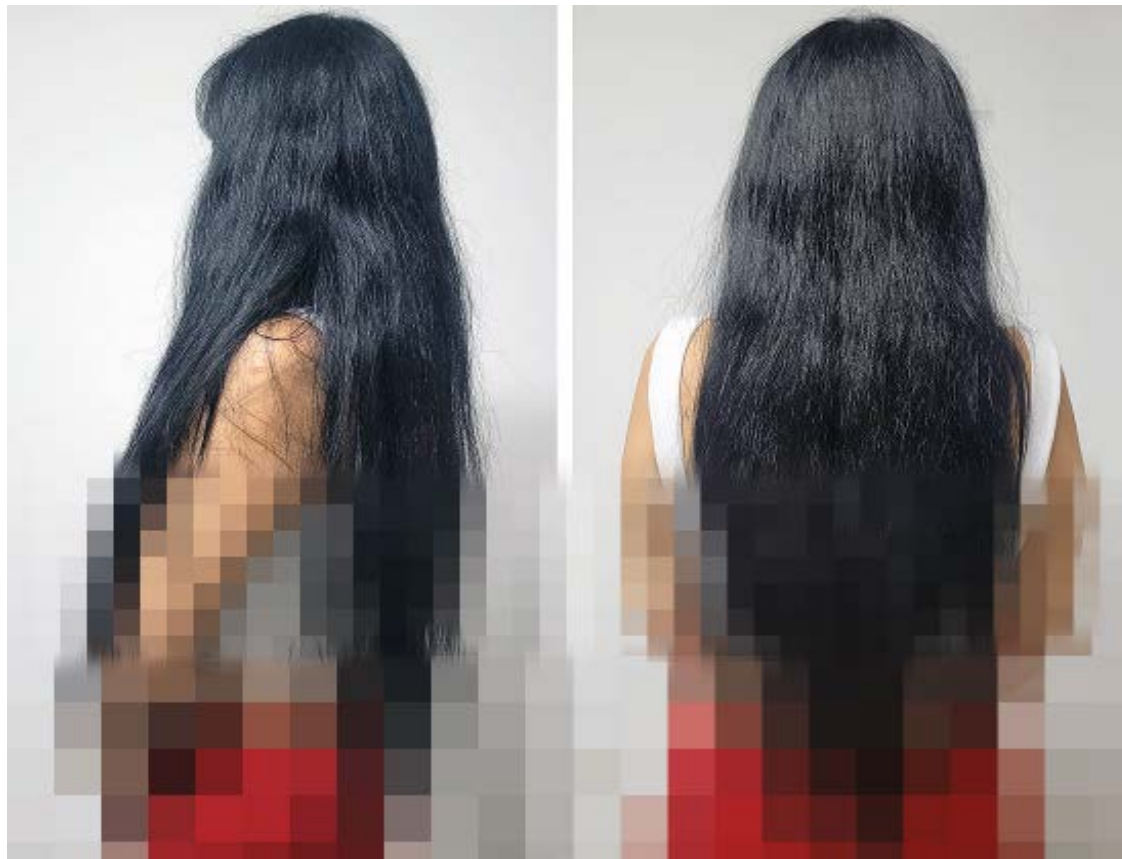
Francisca (un nombre ficticio que utilizamos para proteger su identidad).

Baleares Sin Fronteras: ¿Cómo hizo para contactar con esta persona para la que comenzó a trabajar en