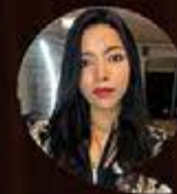
LUISA LA VOZ QUE CANTA LO QUE TU CORAZÓN CALLA.